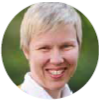
TEKST: KANTOR SOLVOR KVÅLE KONSTALI